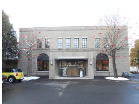
図5：六花亭森林公園店(厚別東)