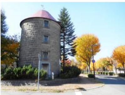
図3：旧馬場牧場サイロ(厚別中央)