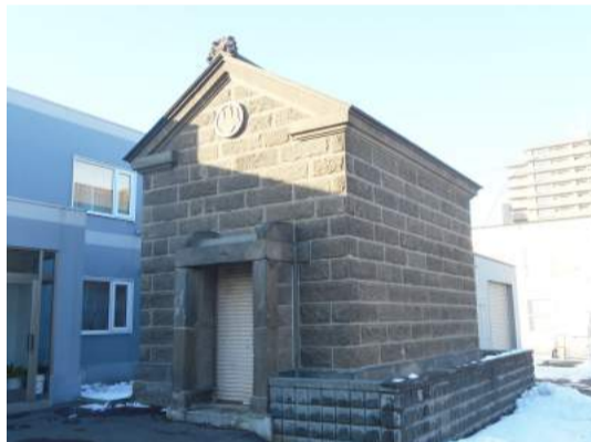
図4：井元宅元穀物蔵(大谷地東)