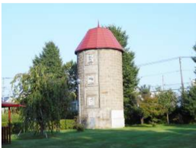
図1：旧宇納牧場サイロ(上野幌)

来たる12月9日(日)、北海道遺産選定を記念して札幌軟石の過去・現在を振り返り、未来を展望するシンポジウムを開催します。会場は北翔大学「ポルト」(中央区南1条西22丁目)で、午後1時からです(参加費無料・申込不要)。どうぞご参加をお待ち申し上げます(詳細は「札幌建築鑑賞会公式ブログ」をご参照ください)。(地域史研究者 杉浦正人)