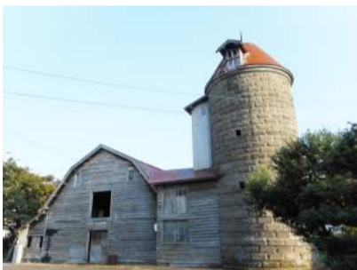
図2：星子牧場サイロ(上野幌)