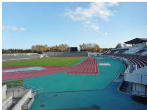
図2：厚別公園競技場