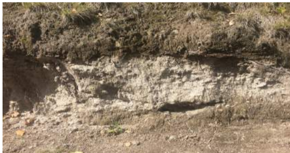
下野幌神社脇の支笏火砕流の露頭