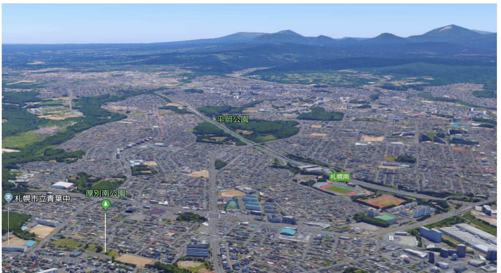
支笏湖に向かってなだらかに高まっていく厚別台地