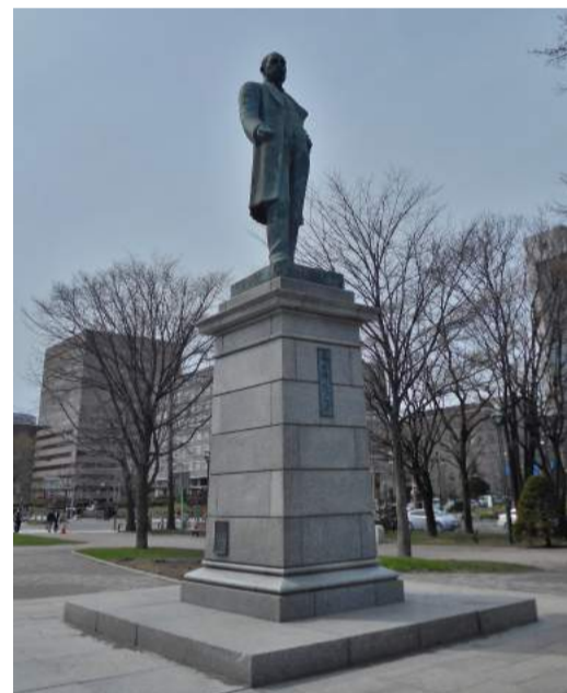
写真③黒田清隆像(大通公園)