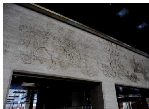
写真④佐藤忠良レリーフ(北海道庁本庁舎)