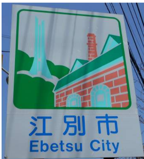
写真①江別市のカントリーサイン

http://keystonesapporo.blog.fc2.com/ 2018.1.27、1.28 記事参照